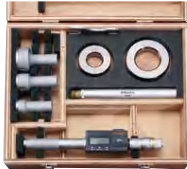
经济型套装 (可更换测头) * 详细信息参见 C-5 页。

* 不使用提供的标配测头，而去使用其它测头；或者使用其它套装的副测头增加测量范围都是不可取的。（不能保证测量精度的准确性）。