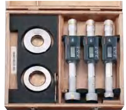
标准套装 (不可更换测头) * 详细信息参见 C-6 页。